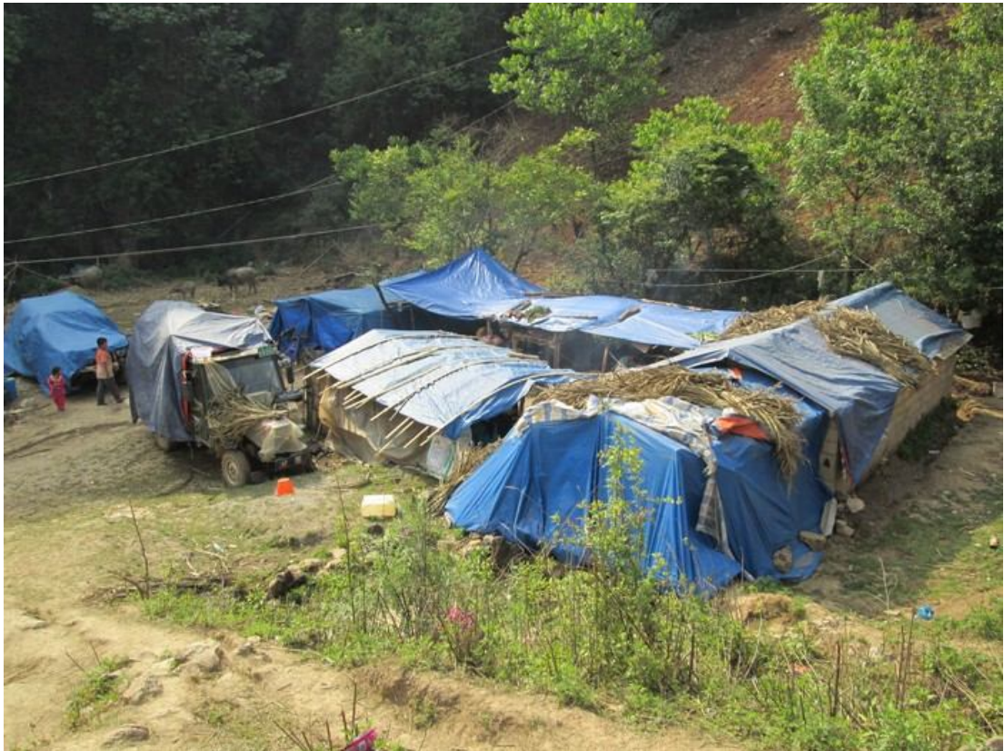
ကိုးကန့် ဒုက္ခသည် တို့ နေထိုင်ရာတဲများ