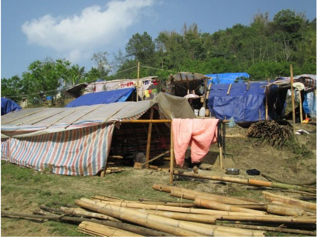
ကိုးကန့် ဒုက္ခသည် နေထိုင်ရာ တဲများ