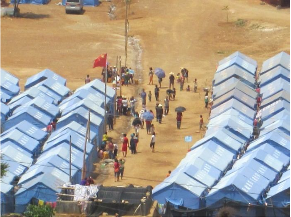
တရုတ်အာဏာပိုင်တို့ တည်သည့် ဒုက္ခသည် စခန်း