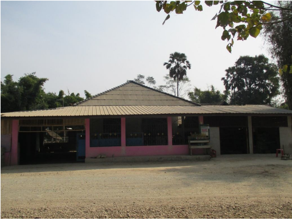
ရှိုခင်းလုံးသမ်တိပ်. တီးမခင်းလုံးထုဂ်,ယိုဝ်းတံ

လုံးသမ်တိပ်. ဂေးကွဂ်,တီးဂေးမး၊ မခင်းလုံးယိုဝ်းပးလိဝ်းကုဂ်;မဂ်;ခိုင်; တင်းခွင်းမဂ်,တိပ်း ကခင်ကပ်မံ. ရှိတ်းဝံ.ခခေ.ယပ်. ကခင်ခေ. မခင်းလုံးဂံ.ပးဝံ.ယူ,တု,သေ,ခခေ.ယပ်.။ မခင်းယိုဝ်းဝံ. လိုဝ်.ခခေဂုလ်းမခင်း ကမ်,ယမ်;ရှိတ်းရှံ.ဗွဲယပ်.ဂေး မခင်းပံဗိတ်;ယခင်လုမ်းသိုဂ်းမခင်း;ခပ် မွဂ်;ထတ်း(ပေ,)ခိုင်; သေခပ်;ဂု, ခင်းရှိုခင်း။ ခပ်;ဂု,ခင်းလုဂ်;ခခေမခင်း တု,မခင်းတေရှိတ်းရှံ. ပိုခင်းခခေ.တိုခင်းကမ်,မိး။ ဂုလ်ဂး လုမ်းသိုဂ်း မခင်း;ခပ်ကပ်ခွင်း;ငုလုဂ်;လုံးမးဝံ.။