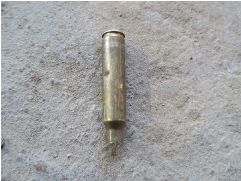
မက်,ဗောင်းခွင်; ကခ်ယိုဝ်းကွဂ်,တိုဝ်.လုးလံးသမ်တိပ်.တံ

မိုဝ်းပိုခ်းယိုဝ်းမခ်းပံ,နှိုင်သင်ခခ်. မခ်းလံးရှင်.ရှံ; သေချးဂျေးလိခ်းဂျးရှပ်,ကပ်မခ်း။ တံးခခ်. သွင် ခေးထီးဂူလ်း မခ်းလံးဂျေးသိုင်ဂမ်,ဂျးတီးခင်းမိုဝ်းချးဂမ်းလိပ်ယပ်.။ “ချးဂျေး ရှင်.ပပ်,ဝျး ရှိတ်းလေး လုဂ်; လံးဂပ်တံယပ်.”ခေံ။ ချးကပ်လုဂ်;လံးချးဝင်းဂျးခိုဝ်လိခ် ခခ်.ယပ်.။