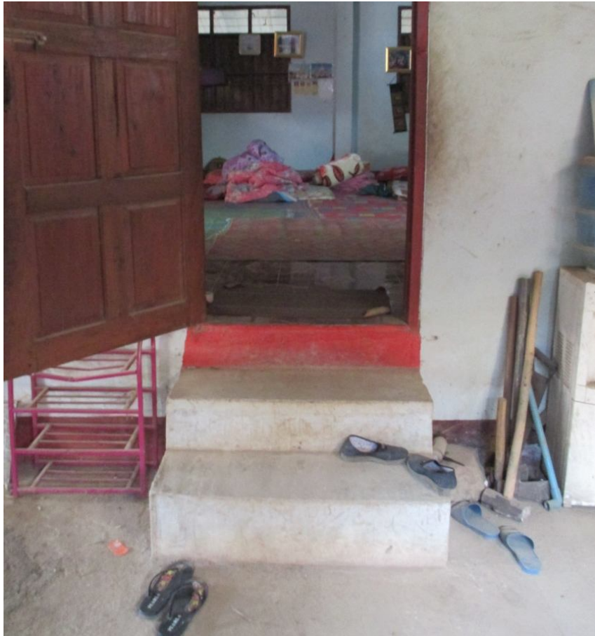
ကွင်းတီးယာင်းတိခ် တီးလံးသမ်တိပ်.ထုဂ်,ယိုဝ်းတံ

မိုဝ်းပိုခ်းယိုဝ်းမခ်းပံ,နှိုင်သင်ခခ်. မခ်းလံးရှင်.ရှံ; သေချးဂျေးလိခ်းဂျးရှပ်,ကပ်မခ်း။ တံးခခ်. သွင် ခေးထီးဂူလ်း မခ်းလံးဂျေးသိုင်ဂမ်,ဂျးတီးခင်းမိုဝ်းချးဂမ်းလိပ်ယပ်.။ “ချးဂျေး ရှင်.ပပ်,ဝျး ရှိတ်းလေး လုဂ်; လံးဂပ်တံယပ်.”ခေံ။ ချးကပ်လုဂ်;လံးချးဝင်းဂျးခိုဝ်လိခ် ခခ်.ယပ်.။