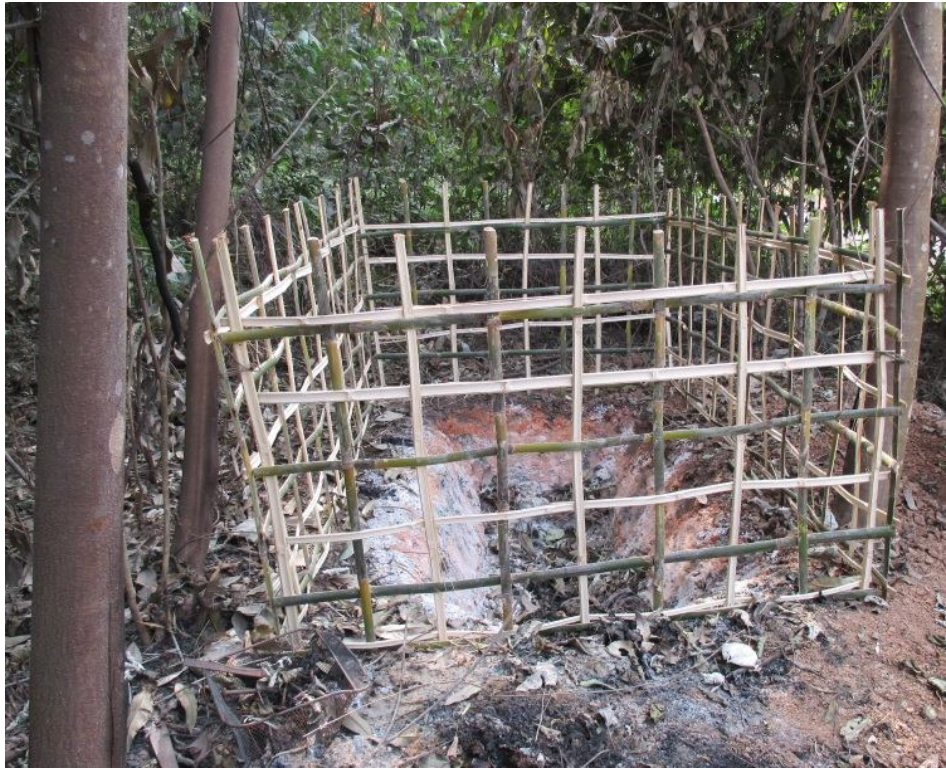
ကွင်းတီး၊ ဖတ်ခင်း၊ တူင်တံ၊ လေးသားတပ်။

ဂမ်းခေခေ. ပူ, လာခေဂေးဂျ, တီးဝတ်. သေ သင်, ခလပ်တီးဝတ်. သမ်. လာတ်; ဝါး ရှမ်းတေလံး; ခုတ်းလိခေ တီး လိုတ်; မခင်းတူင်းခေခေ. သေ ဖတ်လွမ်းခင်း; မခင်း တျ, ဂိတ်, ခခေ. ရှမ်းလွင်းကမ်, လီခေ။