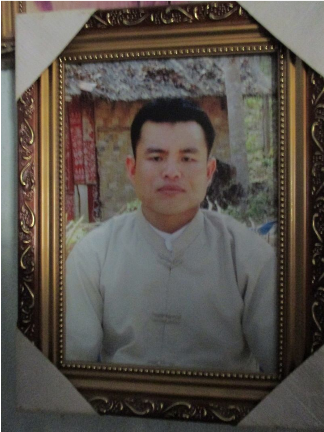
လတီးသမီးတိပ်.

မိုဝ်းယာမ်းဂၢင်ခမ်း၊ 10:30 ခခေင်. လုမ်းသိုဝ်းမၢခင်းခပ်မးဝိတ်.တီးဂ္ဂိုခင်းရှမ်းမး။ မးလးမးမးမး တိုက်.ခွခင်းလမ်းယူ၊ သိုဝ်းမၢခင်းခပ်မးရှင်.ရှမ်းလုက်.သေလၢတ်.ရှမ်းမးပိုတ်.ဗွဲး၊ ခပ်ရှင်. လတီးသမီးတိပ်.ကွက်, တီးခင်းဂးမး ဂူလ်းဂးမခင်းထိုင်ခိုခင်း။ မခင်းဝး “ရှမ်းကမ်,ဂိုတ်းသင်ဗိတ်း”။ ဗွင်းခခေင်.ရှမ်းပေးရှခင် သိုဝ်းမၢခင်းလိုဝ်းခခေင်. ဗုလ်,လုမ်းလူတ်.ပိတ်းယပ်.။ လိုဝ်.ခခေင်လး မခင်းလတီးကမ်,လၢင်း ခပ်လူတ်.ကွက်,ပး။ သိုဝ်းမၢခင်း ခပ် မးဝိတ်.လွပ်းသေကပ်ရှင်းငုတ်. လတီးသမီးတိပ်.ယူ။ ရှမ်းရှခင်လိုဝ်.ခခေင်လး ရှမ်းတူက်းလှိုသေ ဂူဝ်ခပ်တေ ယိုဝ်းသ့, လတီးသမီးတိပ်.လး ရှမ်းရှင်. လုက်;လတီးရှမ်းမးကွက်,တီးဂးခခေင်.မးယပ်.။